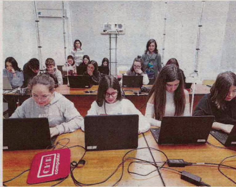
Le notizie in redazione. L'istituto comprensivo Beato Don Pino Puglisi Villafrati Mezzojuso al concorso «Giornalista per un giorno» nel 2019

Il lavoro svolto dalla nostra redazione trae ispirazione dal primo principio, la cultura. Nel manifesto del nostro istituto la cultura è intesa come cultura di comunità, come mezzo per la costruzione di una coscienza civile e antidoto potentissimo contro ogni forma di illegalità. In quest'ottica il lavoro svolto all'interno della redazione scolastica si configura come un'esperienza didattica dal duplice scopo. Da una parte gli alunni, cimentandosi nella realizzazione di un compito di realtà, hanno la possibilità di potenziare conoscenze e competen-